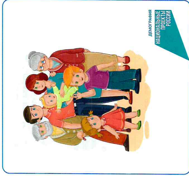
ДЕМОГРАФИЯ НАЦИОНАЛЬНЫЕ ПРОЕКТЫ РОССИИ

Предоставляется независимо от дохода семьи.